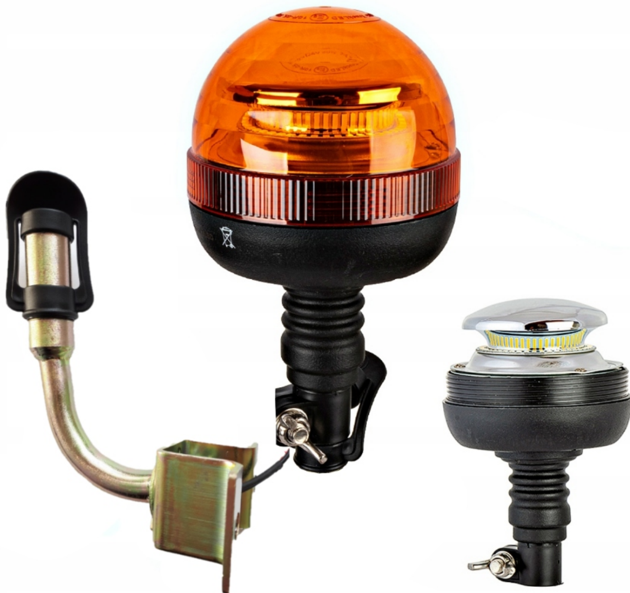
Lampa ostrzegawcza kogut 36 LED 12V 24V z uchwytem